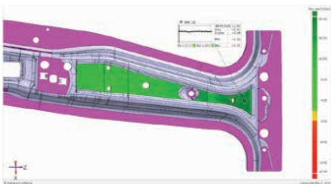
» Slika 3: Statistička analiza i prikaz Ppk vrijednosti

Rezultati mjerenja kompletne površine zatim se uspoređuju s CAD modelom. »ATOS ScanBox ovo radi automatski«, dodaje Girndt. U izvještaju, prikazana su ne samo površinska odstupanja stvarnog stanja od CAD modela, već i tolerancije oblika i položaja kao i dimenzija.