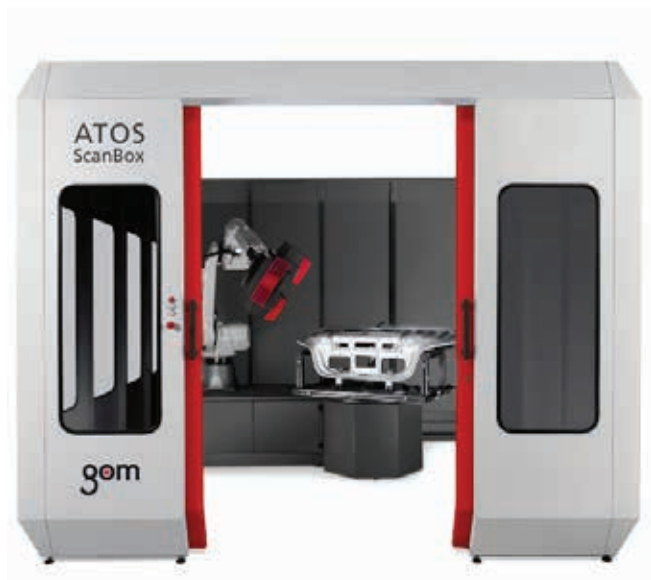
» Slika 1: ScanBox 5120 – 3D mjerenje lima [1]