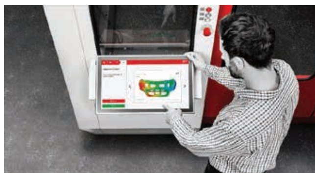
» Slika 5: Jednostavno pokretanje programa za svakog radnika preko ekrana osjetljivog na dodir

Nakon što su gotove pojedinačne komponente proizvedene u zadanim tolerancijama, Metalsa ih šalje izravno kupcu ili prelaze u sljedeći proizvodni proces, primjerice zavarivanje i izradu sklopa. Sklopovi se kontroliraju mjerenjem površinskih točaka, točkama odreza i pozicijom montažnih rupa.