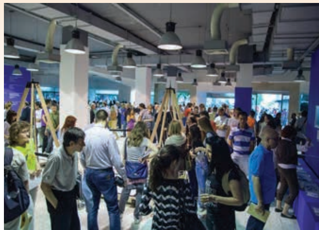
» Manifestacije za tisuće ljudi: »Svibanj – mjesec matematike«

izgradnja planira u narednom razdoblju u Beogradu. Ove godine se, s mojim dolaskom na mjesto v.d. direktora, dogodila još jedna velika promjena u radu. CPN se počeo polako okretati ka znanstvenoj zajednici u Srbiji, pokušavajući povećati vidljivost njenih rezultata te ih povezati i uskladiti s potrebama lokalnih zajednica i uopće gospodarstva i društva u cjelini.