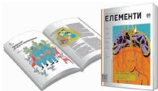
» Dvije godine izlaženja: časopis za promociju znanosti »Elementi«, u izdanju CPN-a, izlazi četiri puta godišnje

U CPN-u sam previše kratko da bih mogao izdvojiti jedan takav projekt. Mogu, međutim, reći da sam ponosan na tim i zajedničku suradnju, kao i na prilagodljivost koju CPN pokazuje. Primjerice, pokušao sam usmjeriti pažnju CPN-a ka pridobivanju finansijskih sredstava iz međunarodnih fondova. Kada bi bili prihvaćeni prijedlozi za projekte koje su samo u posljednja dva i pol mjeseca napisali i poslali zaposleni u CPN-u, bio bi osiguran iznos predviđen proračunom na godišnjoj razini. Bila bi to ozbiljna finansijska potpora za planirano proširenje postojećeg spektra aktivnosti i povećanje učinkovitosti.