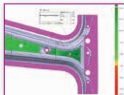
172 Praktičan primjer automatiziranog 3d optičkog mjeriteljstva u suvremenoj industrijskoj proizvodnji limova