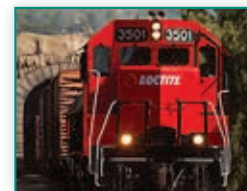
226 Ljepilo, koje može vući vlak!