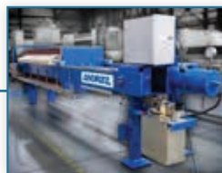
210 Pneumatske preše za filtriranje